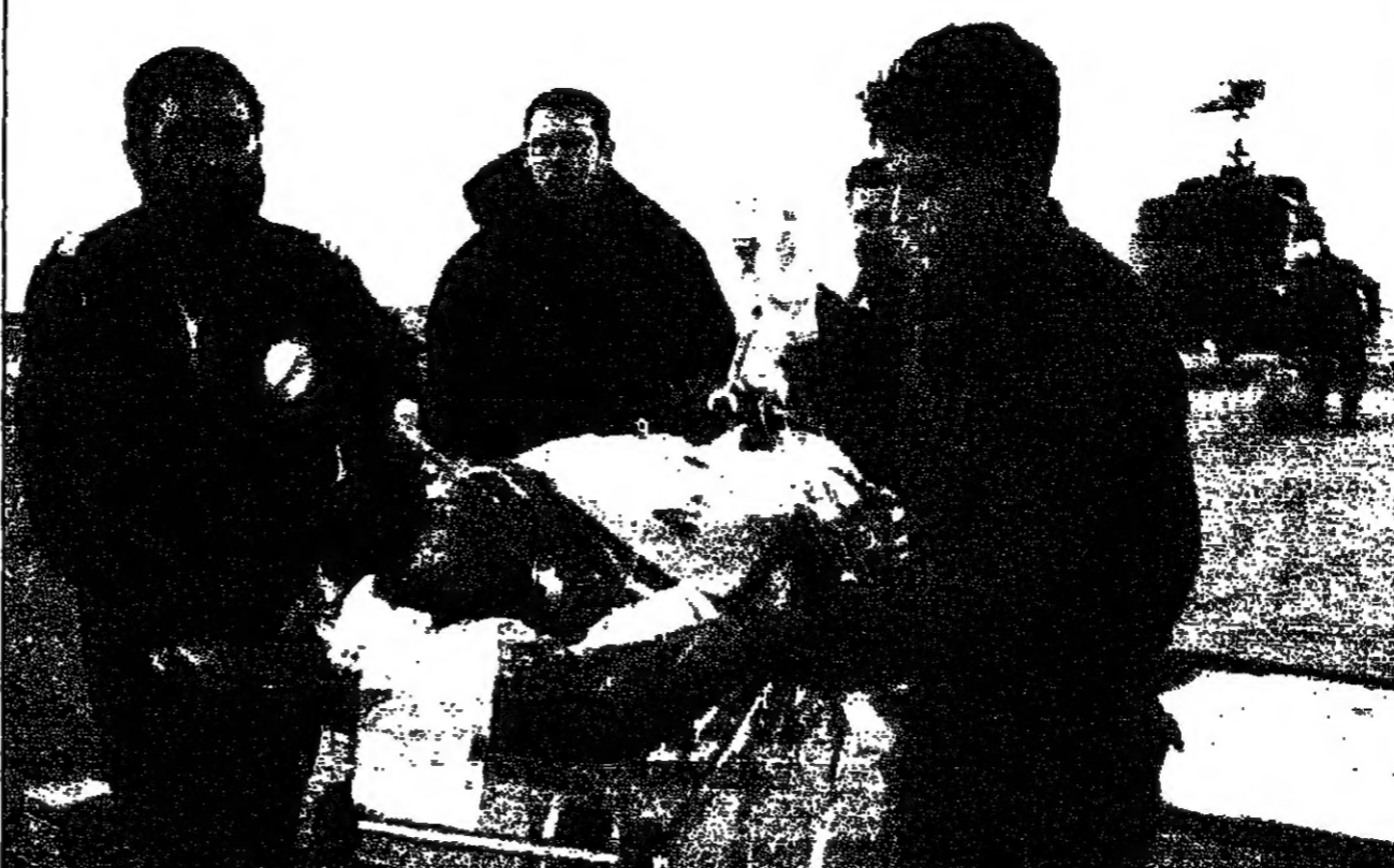
اسرائيليون يتكلمون جنديا جرحا من جراء الاختراقات التي جرت في جنوب لبنان أمس الأول

باريس - ف. ب. - صرح رئيس الوزراء السوداني السابق الصادق المهدي أمس الاثنين ان الولايات المتحدة لا تدعم عملا عسكريا ضد النظام الاسلامي الحاكم في الخرطوم، غير انه أكد مجددا ان سؤاها هذا النظام بات أمرا محققا.